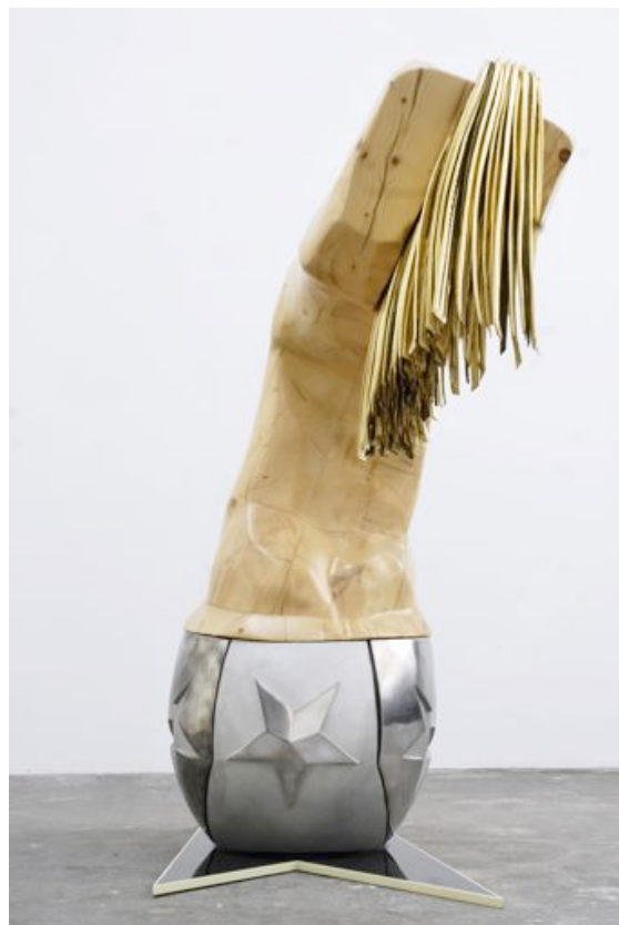
Wilfrid Almendra / Le Flamboyant / 2008 Bois, fonte d'aluminium, acier, cuir, silicone, vernis, clark, peinture, feutre, 200 x 160 x 95 cm