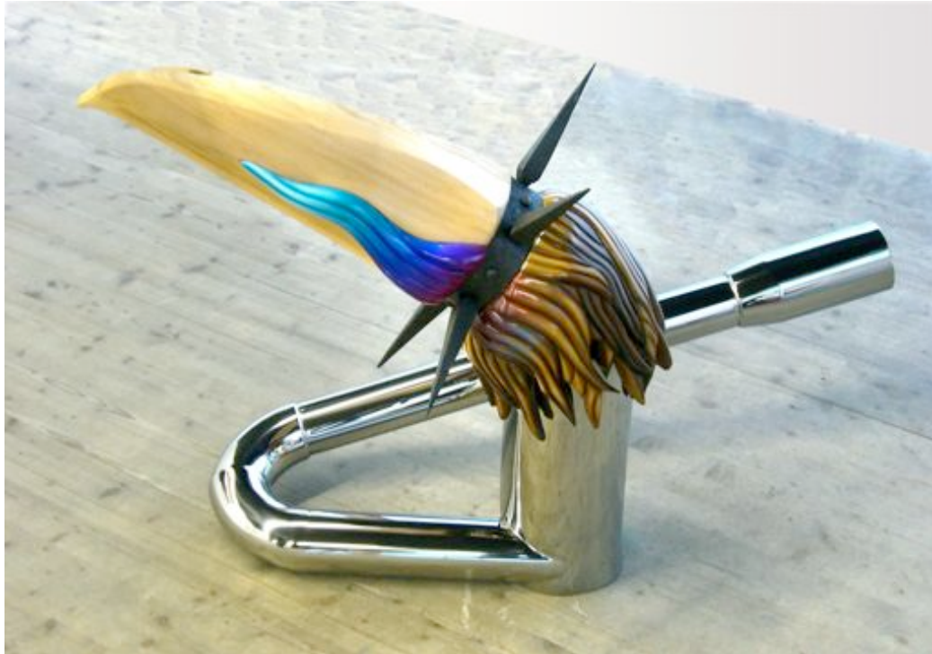
Wilfrid Almendra / Mister Bird Head / 2007, Bois, inox, résine, peinture, 100 x 60 x 100 cm, Courtesy Cosmic galerie