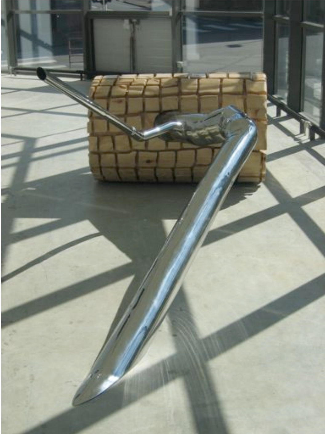
Wilfrid Almendra / Mimosa /2006, Bois, aluminium, acier, 150 x 380 x 130 cm